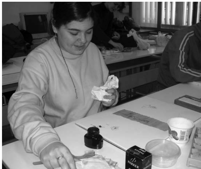
— Revestimientos Murales.